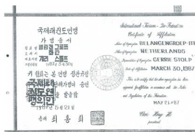
Het logo van de ITF-Belangengroep en de originele plaque van de ITF!!!